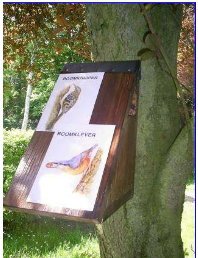
boomklever en boomkruiper